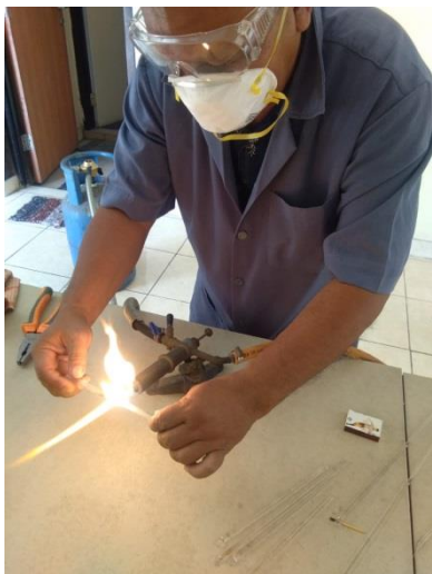
Gambar 2. Teknik Pemanasan Gelas Diatas Nyala Api

perlahan-lahan putar pipa itu agar seluruh bagian tempat pembengkokkan terkena panas. Setelah kelihatan gelasnya lunak, keluarkan pipa dari api dan teruskan pemutaran pipa 2 sampai 3 detik, bengkokkan sesuai dengan keperluan.