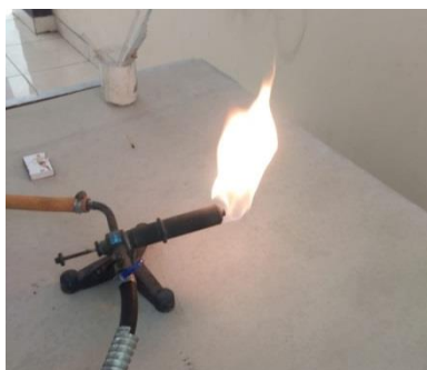
Gambar 1. Nyala api yang digunakan untuk memanaskan gelas

Bahan dasar dari pembuatan alat-alat gelas berasal dari limbah alat-alat yang sudah pecah dan tidak terpakai. Alat-alat gelas yang sudah pecah tidak dapat digunakan kembali dan tidak dapat dibuang di sembarang tempat karena sangat berbahaya. Sebelum melakukan pembuatan alat-alat gelas terlebih dahulu untuk memilih bahan dasar dari alat gelas yang sudah tidak terpakai. Dilakukan pemilahan pecahan gelas berdasarkan merknya karena mempunyai titik leleh yang berbeda-beda. Untuk gelas pyrex mempunyai titik leleh 515 °C. Gelas duran mempunyai titik leleh yang lebih rendah yaitu 510 °C. Sedangkan gelas iwaki dan gelas yena mempunyai titik leleh berturut-turut 500 °C dan 400 °C. Dan untuk soft gelas mempunyai titik leleh paling rendah yaitu 200 °C. Bahan dasar dipilih sesuai dengan jenis kaca yang diperlukan dan sesuai dengan alat gelas yang akan dibuat. Kemudian disiapkan nyala api yang digunakan untuk memanaskan gelas. Nyala api berasal dari elpiji yang telah dipersiapkan sebelumnya seperti pada Gambar 1.